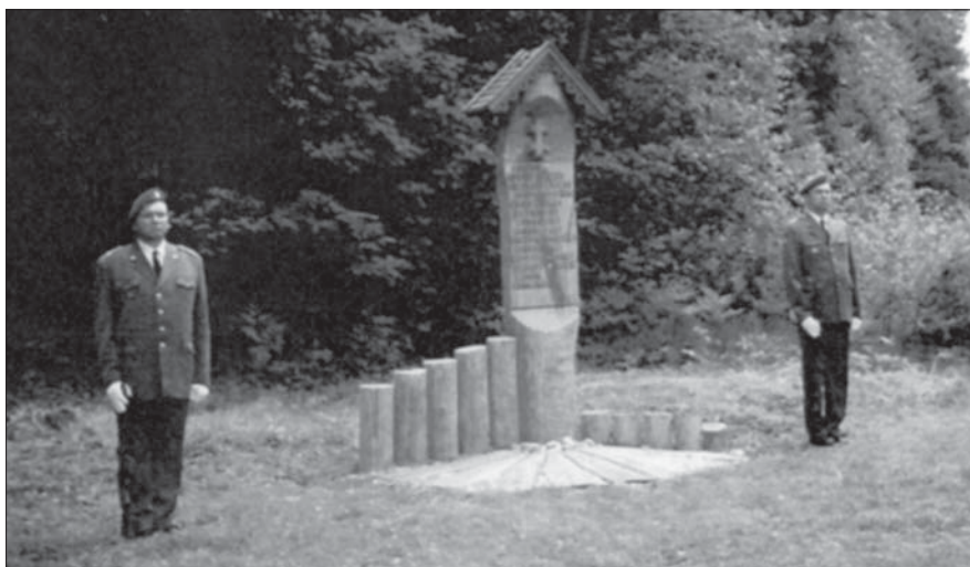
Koplytstulpis partizanų vadų pasitarimo vietoje