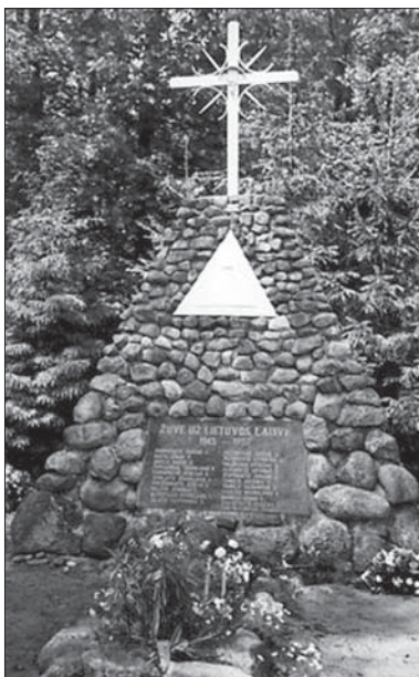
Paminklas Šimkaičių karžygiams

1990 m. giminės ir artimieji pastatė paminklą su bendru žuvusiųjų pavardžių įrašu.