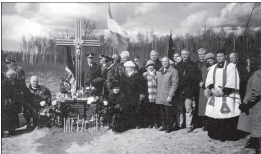
Vienuolikos partizanų žuvimo vieta

pribloškiantis ją prie kapo. Ji mato, kaip stribas pašoka virš kapinių tvoros suplyšta į skutus ir išsitaško ant tvoros, medžių, žolės. Jai pasidaro bloga, tokį vaizdą ji regi pirmąkart, tačiau smalsumo vedama išeina iš kapų apžiūrėti įvykio vietas. Randa apardyta kauburio žemę, aplink jį krauju apšlakstyta žolę ir gabalus buvusio stribo kūno, išsklidusio aplink. Dievobaimingai persižegnoja ir skubiai pasišalina.