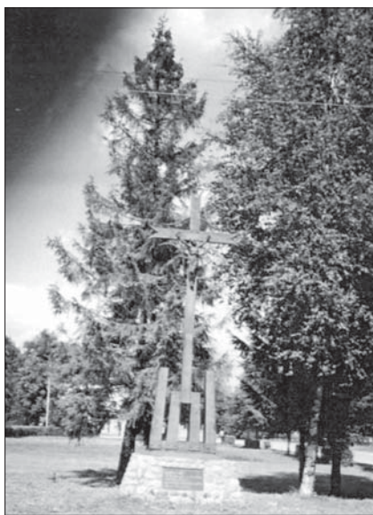
Paminklas žuvusių partizanų niekinimo vietoje. Eržvilko miestelio aikštė ties bažnyčia

Sustok, erzvilkieti, Po kryžium prie švento akmens. Pasiėmėm kančią, Šviesiausiąją viltį palikome tiems, Kas po mūsų gyvens.