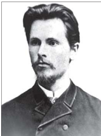
Dr. Vincas Kudirka

„Tėvynė žiūri į tave, kelkis – tu jai reikalingas!“