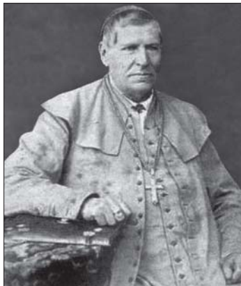
Vyskupas Motiejus Valančius

Minint Žemaičių vyskupo Motiejaus Valančiaus 135-ąsias mirties metines