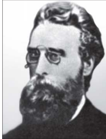
Dr. Jonas Basanavičius