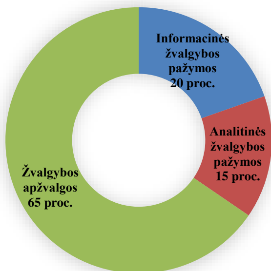
1 pav. Žvalgybos produktai

užtikrinančios valstybės institucijos. Didžiąją produktų dalį sudarė Departamento kasdien rengiamos žvalgybos apžvalgos. Analitinės ir informacinės pažymos sudarė 35 proc. visų produktų. Žvalgybos pažymose VSD dažniausiai teikė informaciją apie grėsmes konstituciniams valstybės pagrindams, ekonominiam šalies saugumui, saugumo situaciją regione. 2017 m. Departamentas taip pat rengė žvalgybos pristatymus kitoms valstybės institucijoms įvairiomis nacionalinio saugumo temomis. Žvalgybos pristatymų Lietuvos Respublikos valstybės institucijoms ir užsienio partneriams buvo surengta dvigubai daugiau negu 2016 metais. Tai atitinka VSD siekį efektyviau bei operatyviau teikti informaciją sprendimus priimančioms institucijoms bei didinti tarnautojų ir pareigūnų kompetenciją nacionalinio saugumo klausimais.