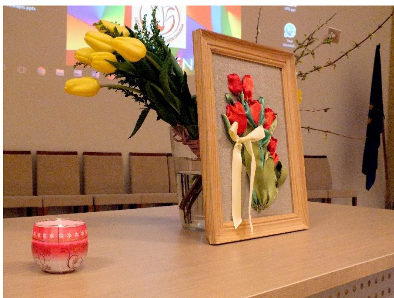
Parkinsono ligos simbolis – tulpė.