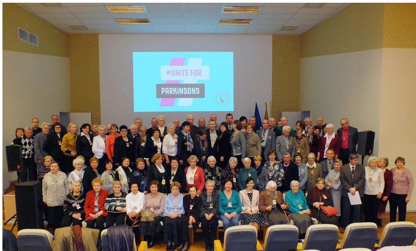
Konferencijos dalyviai prisijungė prie Pasaulinės Parkinsono ligos dienos minėjimo akcijos: „200 metų be gydymo yra per ilgai!!!“