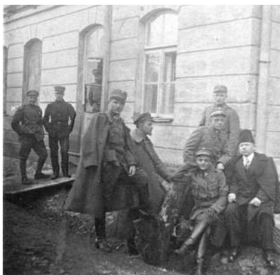
Panevėžio srities apsaugos būrio štabas 1919m. pavasarį Kėdainiuose