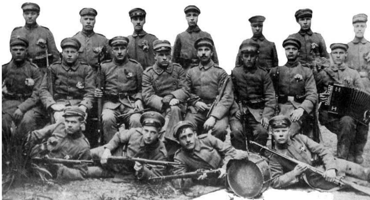
Kėdainių srities apsaugos būrys po 1919 m. vasario 7 d. mūšio su bolševikais ties Kėdainiais