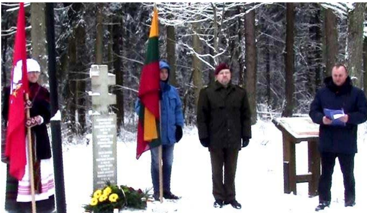
Partizanų bunkeris Pagrendos miške