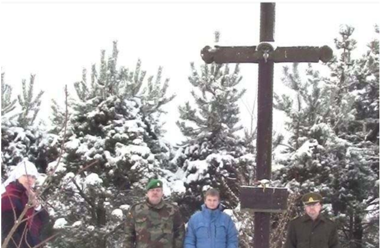
„Magazinas“ Šilo g., kur buvo užkasami nužudytieji