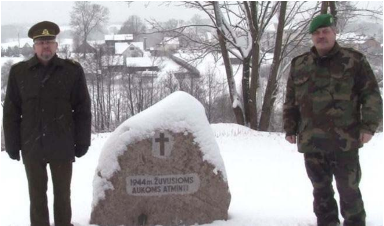
Šalia NKVD sunaikintos areštinės, Trakų g. 83