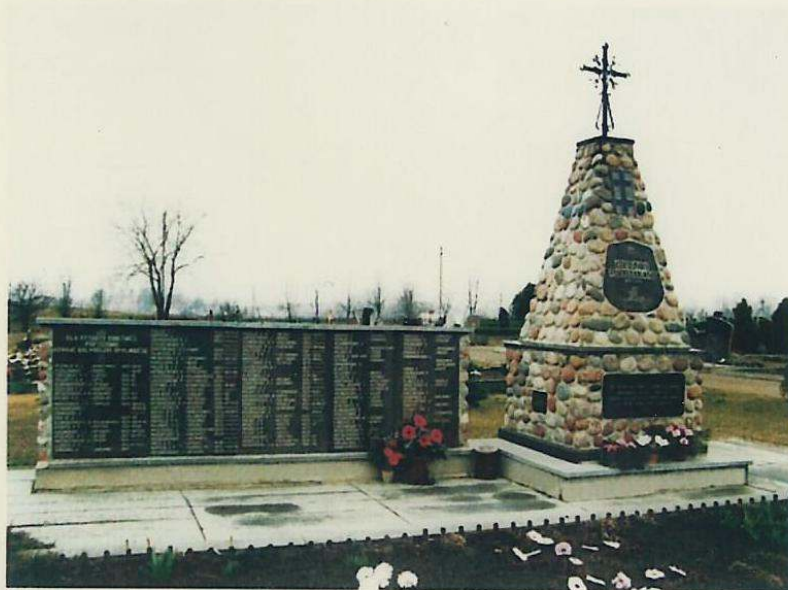
Vytauto rinktinės partizanų memorialus naujosiose Kalvarijos kapinėse, atidengtas 1991 m. rugsėjo 14 d.